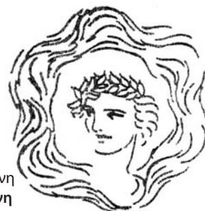
Ο Λογότυπος του Ιδρύματος Δωρεά του καλλιτέχνη Δημητρίου Ταλαγάνη